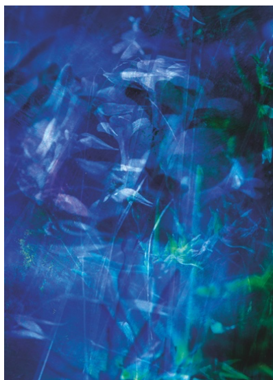
Vanessa Udriot, Camino #1 , impression sur textile montée sur chassis en bois, 130x210x4,5cm, 2023