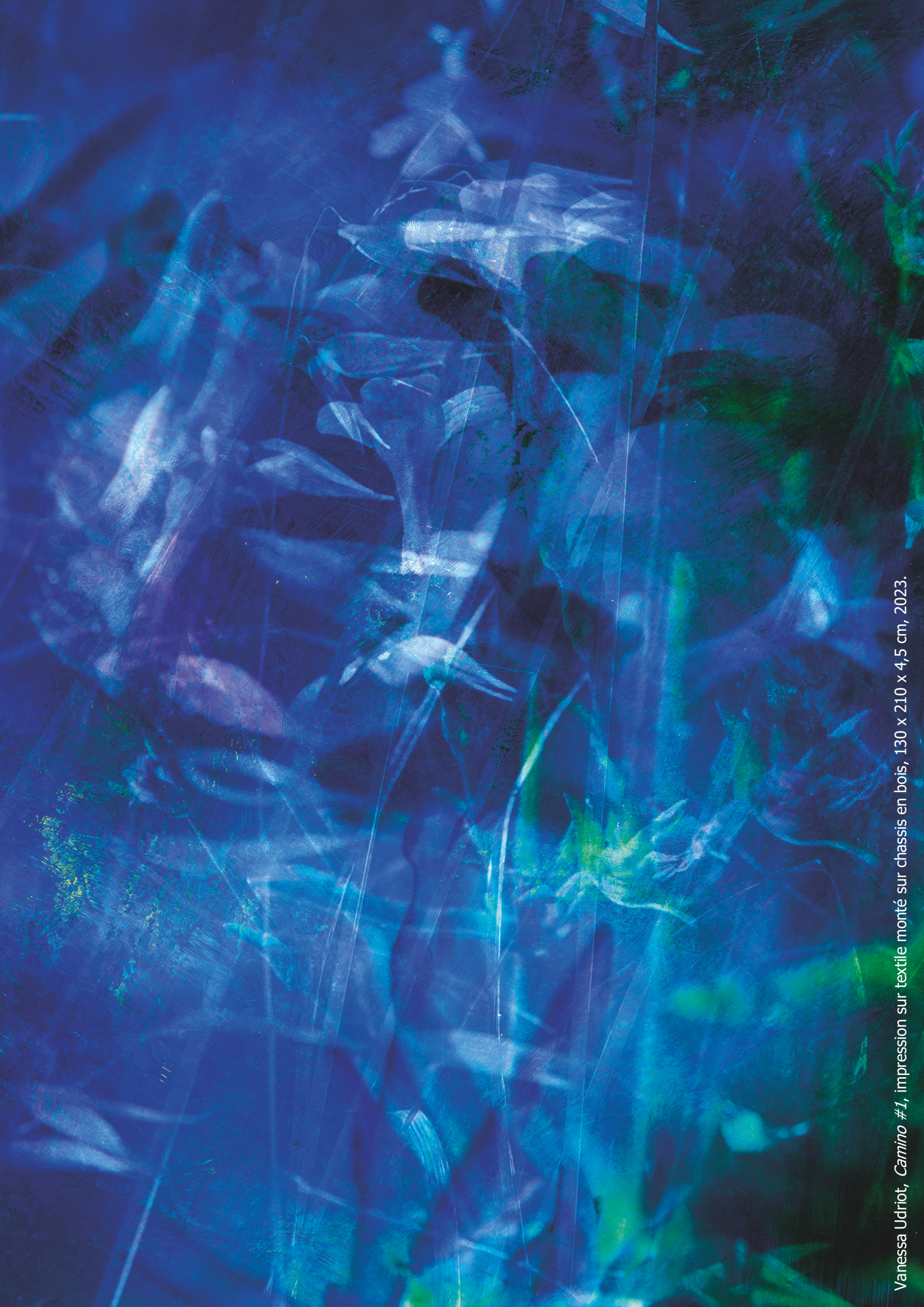
Vanessa Udriot, Camino #1 , impression sur textile monté sur châssis en bois, 130 x 210 x 4,5 cm, 2023.