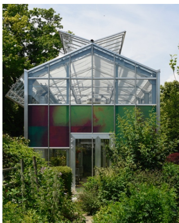
Vanessa Udriot, Colloquium , impression sur autocollant, dimensions variables, Jardin Botanique, Lausanne (CH), 2021.