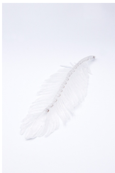
Vanessa Udriot, Oyendau Pluma , impression sur plexiglas 70x100cm, 2023.