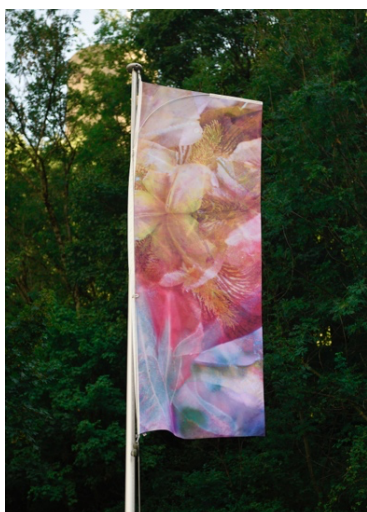
Vanessa Udriot, Tinctoria , « Iris + Pastel », impression sur textile, 100 cm x 300 cm, Le Manoir «GPS OFF», La Montée aux drapeaux Martigny (CH), 2022.